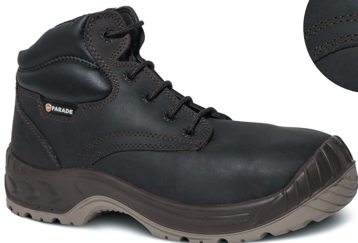
■ 2845 MARRON | POINTURE : 39 AU 48