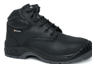
■ 2844 NOIR

MATIÈRE CUIR PULL-UP RESISTANCE À L'HUMIDITÉ 7H