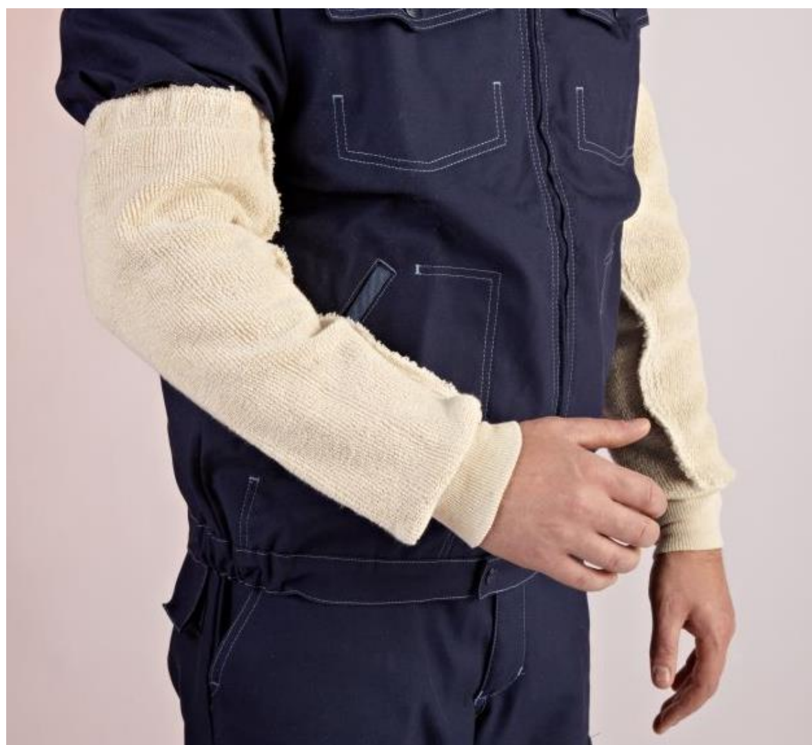
EPI de catégorie 2