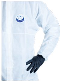
Manche raglan pour plus d'aisance