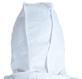
Capuche 3 pièces pour une liberté de mouvement