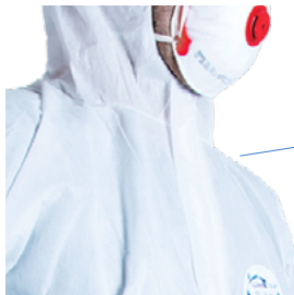
Rabat autocollant pour une étanchéité totale