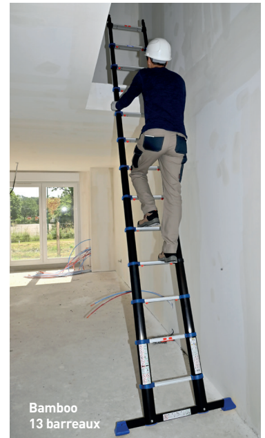
Bamboo 13 barreaux